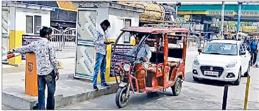
अंबाला। छावनी रेलवे स्टेशन पर लगाए गए बूम बैरियर।

अब रेलवे की ओर से भी नए छह महीने में कंपनी की तीन लाख का तलाश शुरू करने की बात कही जा रही है। अंबाला मंडल की ओर से दिल्ली की एक निजी कंपनी को छावनी रेलवे स्टेशन पर बूम बैरियर का ठेका दिया था। बताया है कि इस कंपनी के पास कई बड़े शहरों के रेलवे स्टेशन का भी ठेका है। मगर छावनी रेलवे स्टेशन पर रोज हो रहे घाटे की वजह से कंपनी बेहद परेशान थी। दिनोंदिन उसका घाटा बढ़ रहा था। इससे छह महीने में ही कंपनी ने ठेका छोड़ने का निर्णय लिया। इस सिलसिले में रेलवे को एक लेटर भी भेजा गया है।