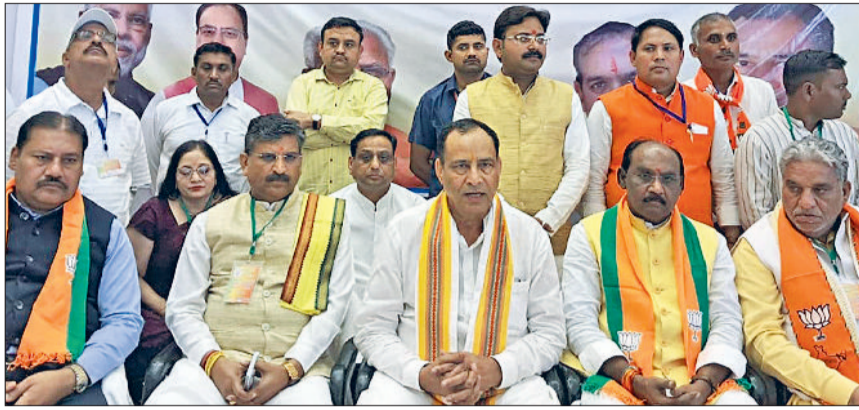
पानीपत। प्रेस वार्ता करते हुए भाजपा प्रदेशाध्यक्ष मोहन लाल बडौली, मंत्री कृष्ण पंवार, मंत्री कृष्ण बेदी आदि।

बैठक में पार्टी पदाधिकारियों ने सरकार की नीतियों पर चर्चा की और आगामी कार्यक्रमों की रूपरेखा तय की हरिभूमि न्यूज ▶ पानीपत