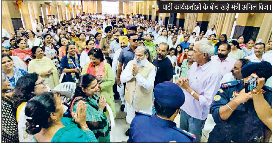
पार्टी कार्यकर्ताओं के बीच खड़े मंत्री अनिल विज।