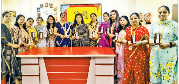
अंबाला। प्रतियोगिता में हिस्सा लेने वाली शिक्षिकाएं।

अंबाला शहर के पुलिस डीएवी पब्लिक स्कूल में हिंदी दिवस पर कविता प्रतियोगिता का आयोजन किया गया। इस प्रतियोगिता में स्कूल के अध्यापकों ने भाग लिया। अध्यापकों ने हिंदी दिवस और अन्य विषयों पर कविता पाठ किया। अध्यापकों ने कहीं वर्तमान मुद्दों पर, तो कहीं माता-पिता पर कविताएं बोलीं। तो कहीं संवाद के माध्यम से भरत व कैरई के वार्तालाप को कविता के माध्यम से दर्शाया। मानव जीवन चक्र पर बहुत सुंदर-सुंदर