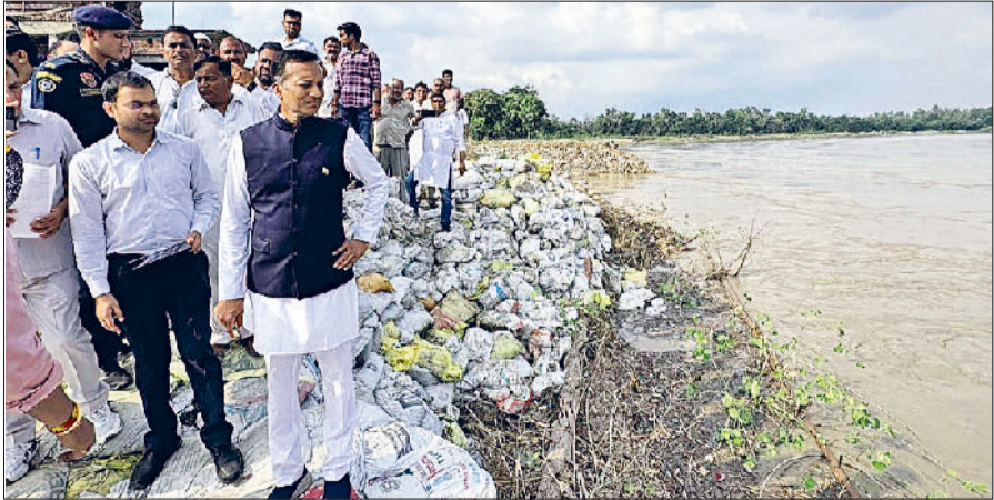
यमुनानगर। कमालपुर टापू में भूमि कटाव का निरीक्षण करते हुए सांसद नवीन जिंदल।

कुरुक्षेत्र लोक सभा के सांसद नवीन जिंदल ने प्रशासन के अधिकारियों के साथ यमुनानगर के गांव टापू कमाल पुर में पहुंचकर यमुना नदी से हुए भूमि कटाव का निरीक्षण किया। इस दौरान उन्होंने ग्रामीणों से बातचीत कर हालात का जायजा लिया। उन्होंने संबंधित अधिकारियों को निर्देश दिए कि वे यमुना नदी के तटबंधों को और अधिक मजबूती प्रदान करें और पुरख्ता प्रबंध करें। ताकि भूमि कटाव को रोका जा सके। सांसद नवीन जिंदल ने निरीक्षण के दौरान ग्रामीणों एवं